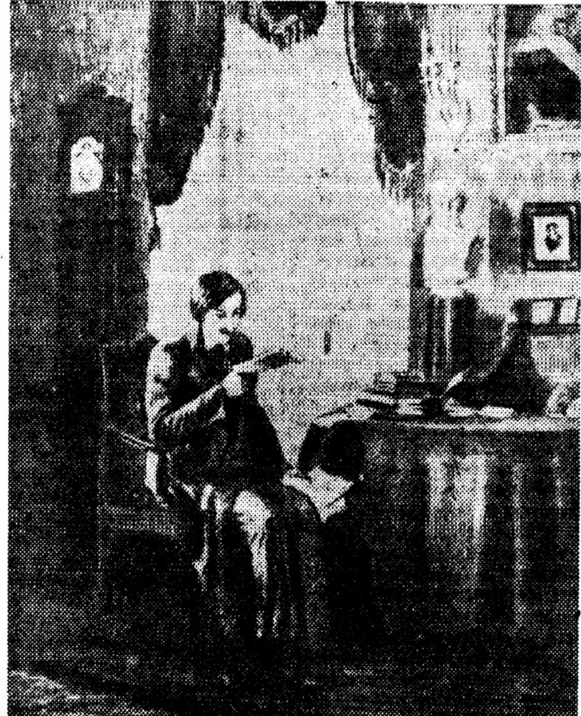
Н. В. Гоголь. (Деталь картины И. Гейлера «Гоголь и Жуковский у Пушкина в Царском селе».)