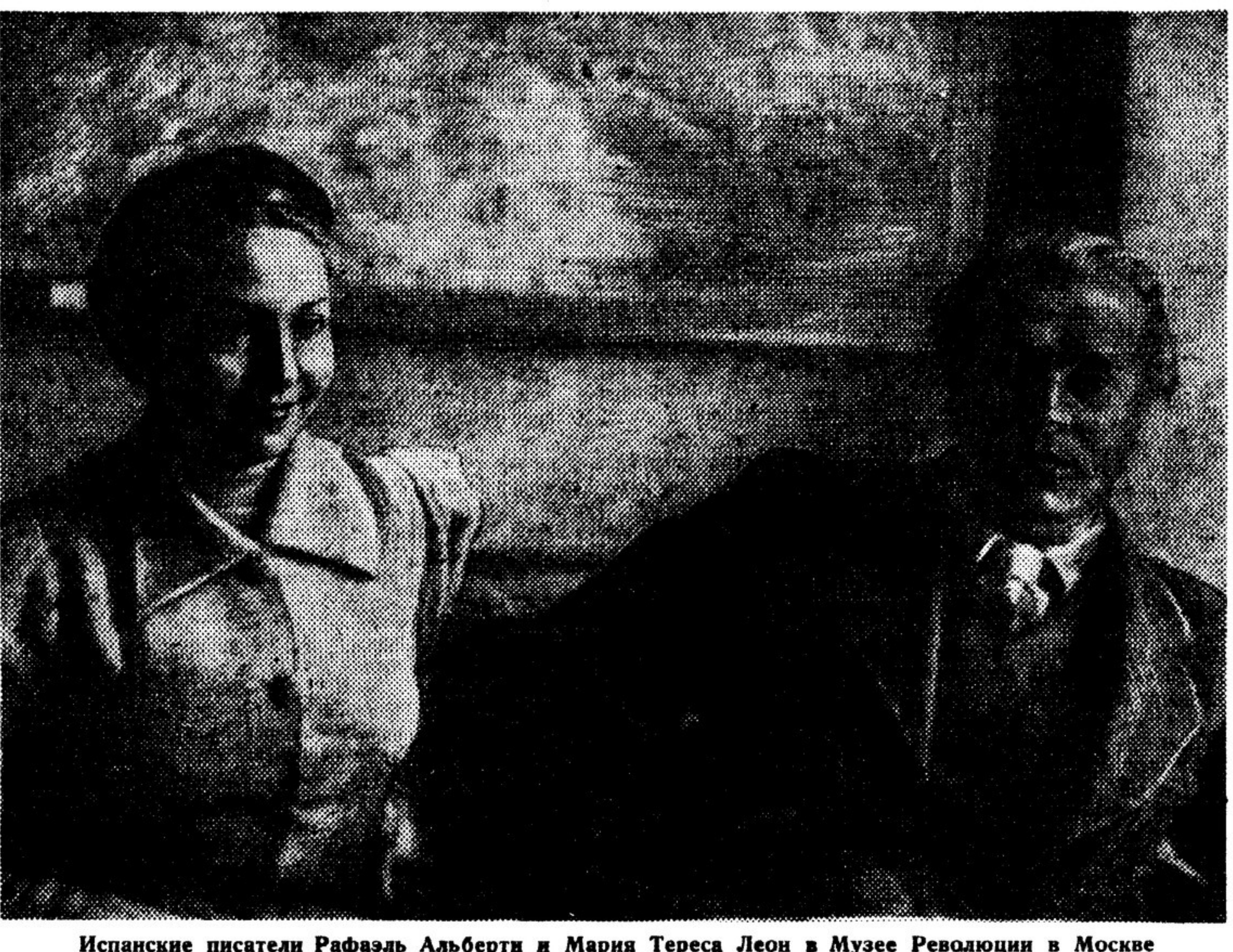
Испанские писатели Рафаэль Альберти и Мария Тереса Леон в Музее Революции в Москве.

Доклад на пленуме о подготовке к великой годовщине Октября и прения по нему обнаруживают ясную волю руководства Союза и широких писательских кругов к перестройке работы по-новому. Четвертый пленум правления ССП показал, что писатели Советской страны, преланные идеям коммунизма, сплоченные вокруг партии Ленина — Сталина, не хотят мириться с серьезными недостатками и прорывами в работе своей писательской организации. Дело руководящих органов союза — эту единую волю литераторов к перестройке своей организации на новых началах, к превращению ее в могучий творческий коллектив, воплотить в конкретные политические и организационные мероприятия. За них надо приниматься немедленно.