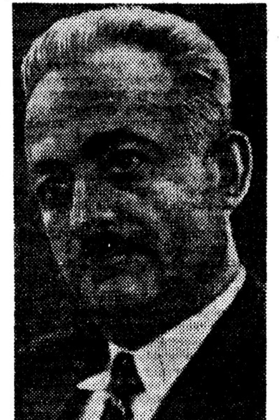
— Мы, советские писатели, должны прийти к 20-летию Октября во всеоружии.

Одна из самых поразительных личностей, которых знает наша действительность, это — покойный Островский.