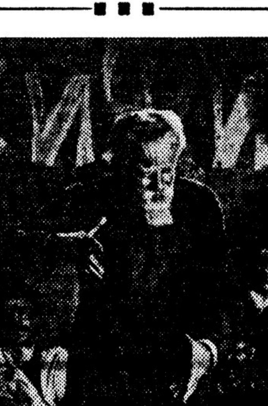
Кадр из фильма «Депутат Балтики»