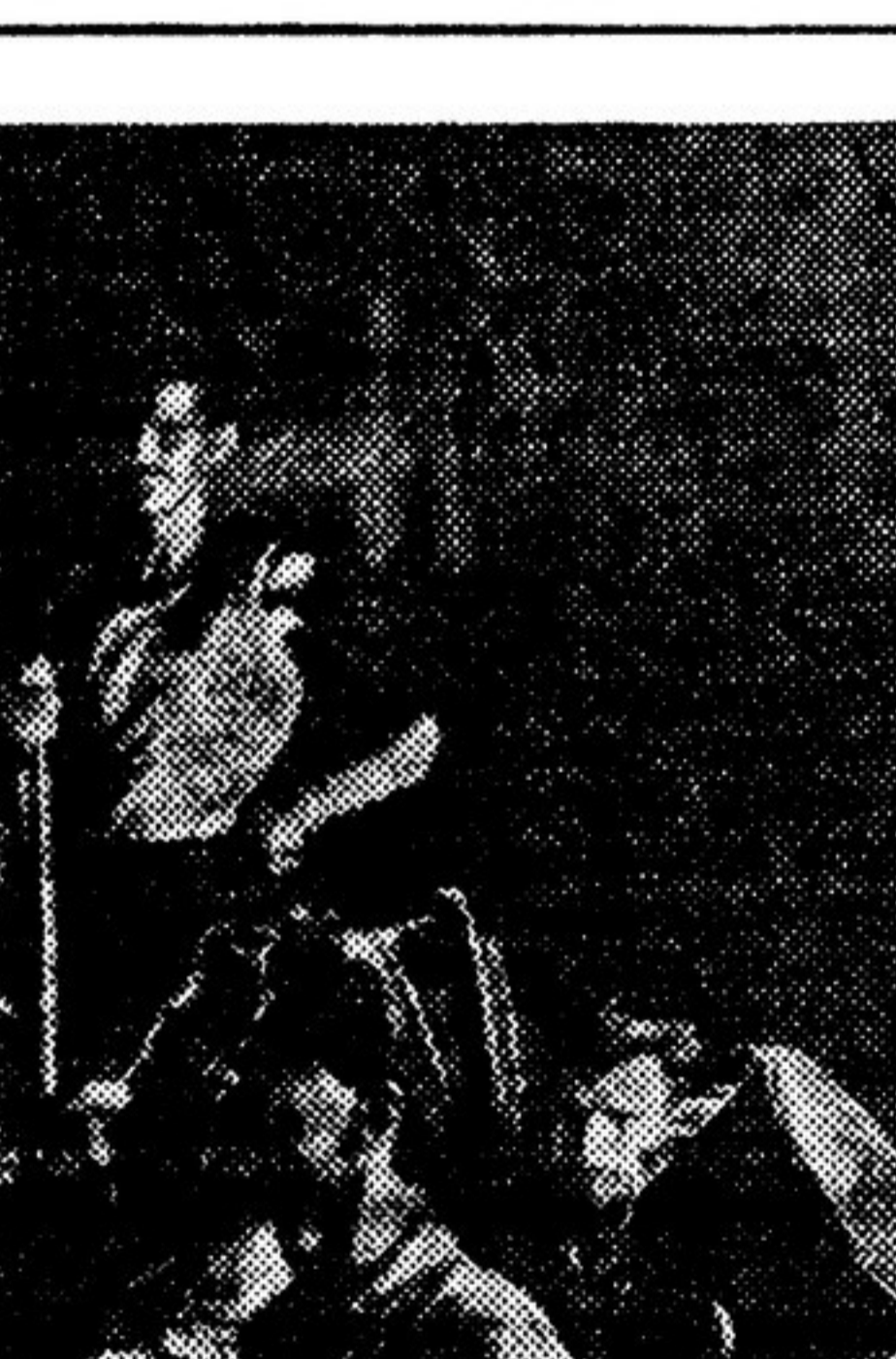
Кадр из фильма «Депутат Балтики»

Как видим, и в 1935 г. картина в «Новом мире» была весьма неутрачена. Политическое неблагополучие, полный провал в работе редакции.