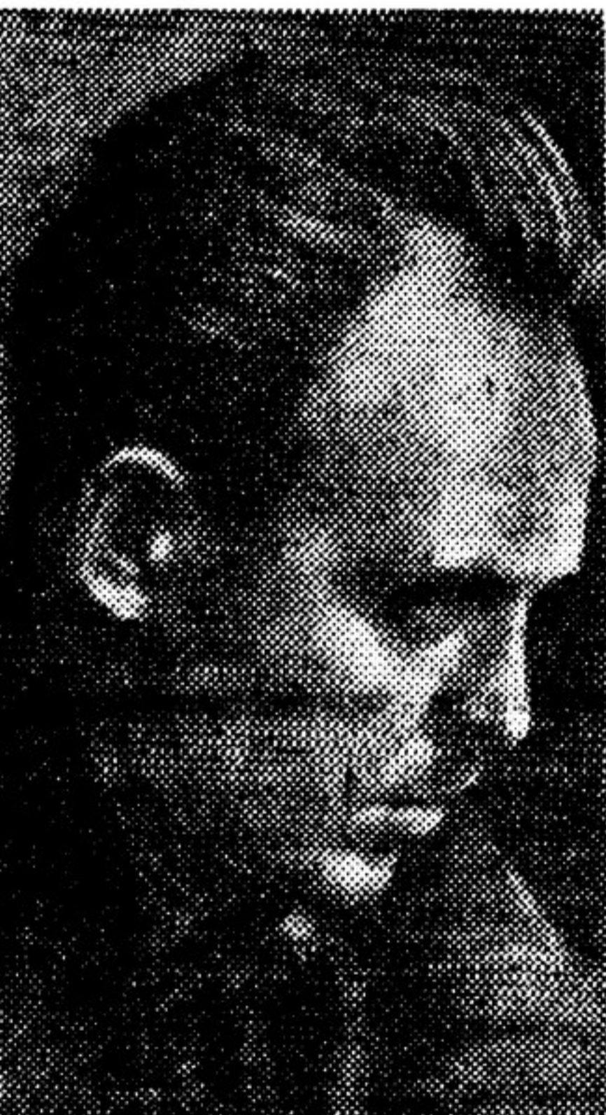
— Мы, советские писатели, должны прийти к 20-летию Октября во всеоружии.