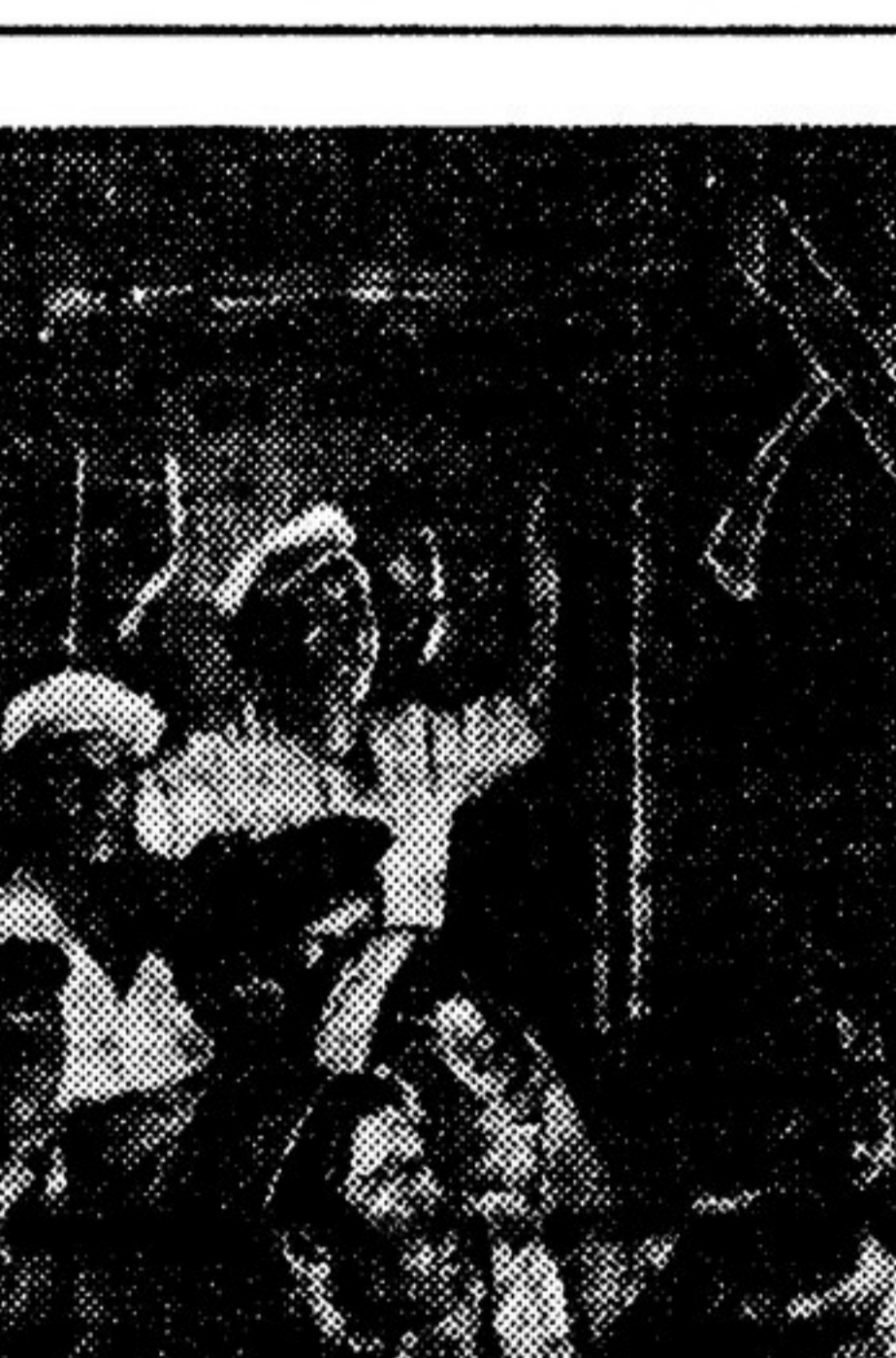
Кадр из фильма «Депутат Балтики»

Хочется от всего сердца сказать: спасибо гениям Ленина и Сталина, породившим нас с гением Пушкина!