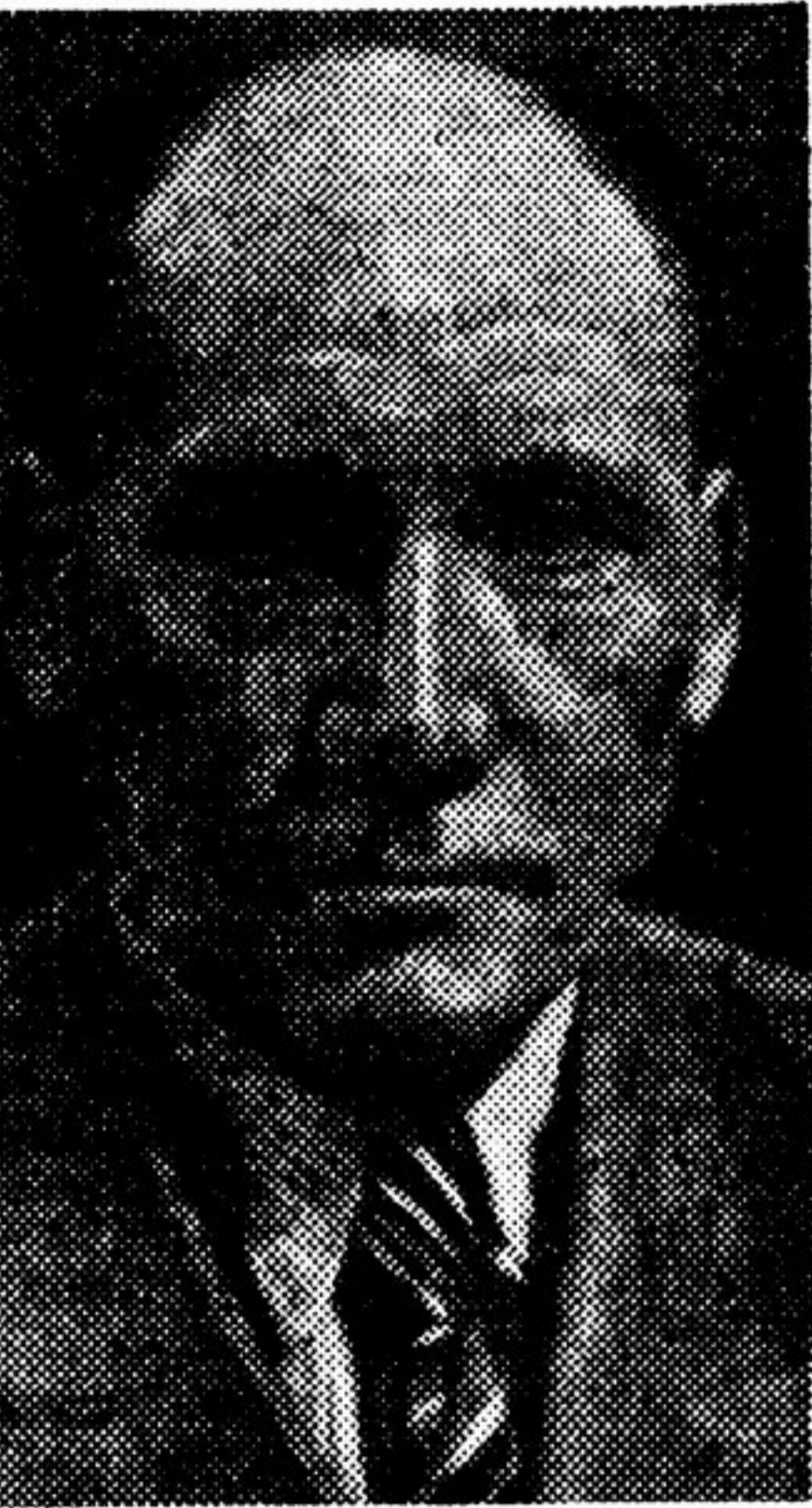
Александр Сергеевич нам, башкирам, дорог еще тем, что он в своем замечательном произведении «Нактавская дочка» с большой правдивостью и мастерством описывает участие башкир в пушеческом движении.